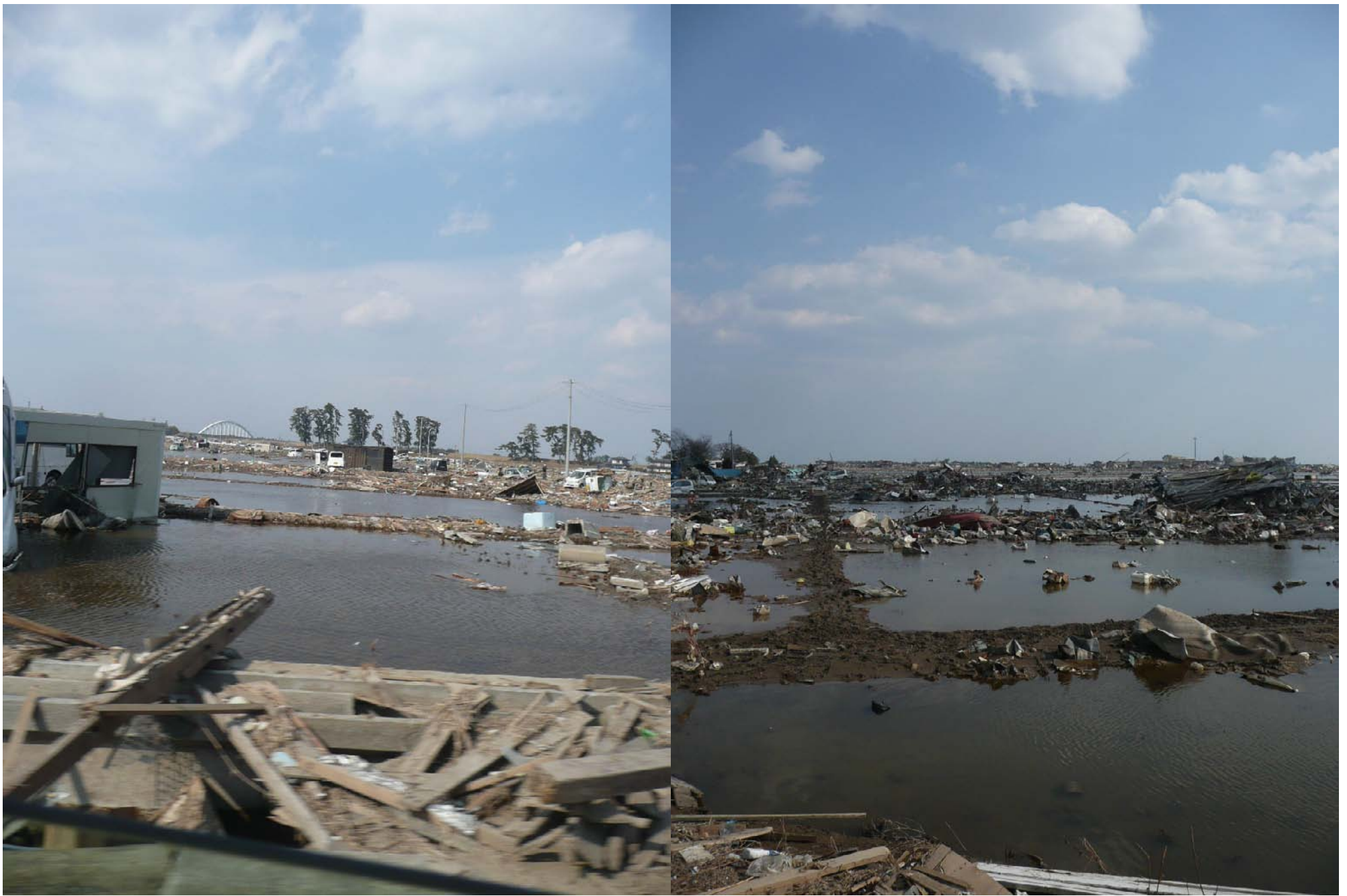
2011.03.29 名取市 10日以上経過したが水はひかない