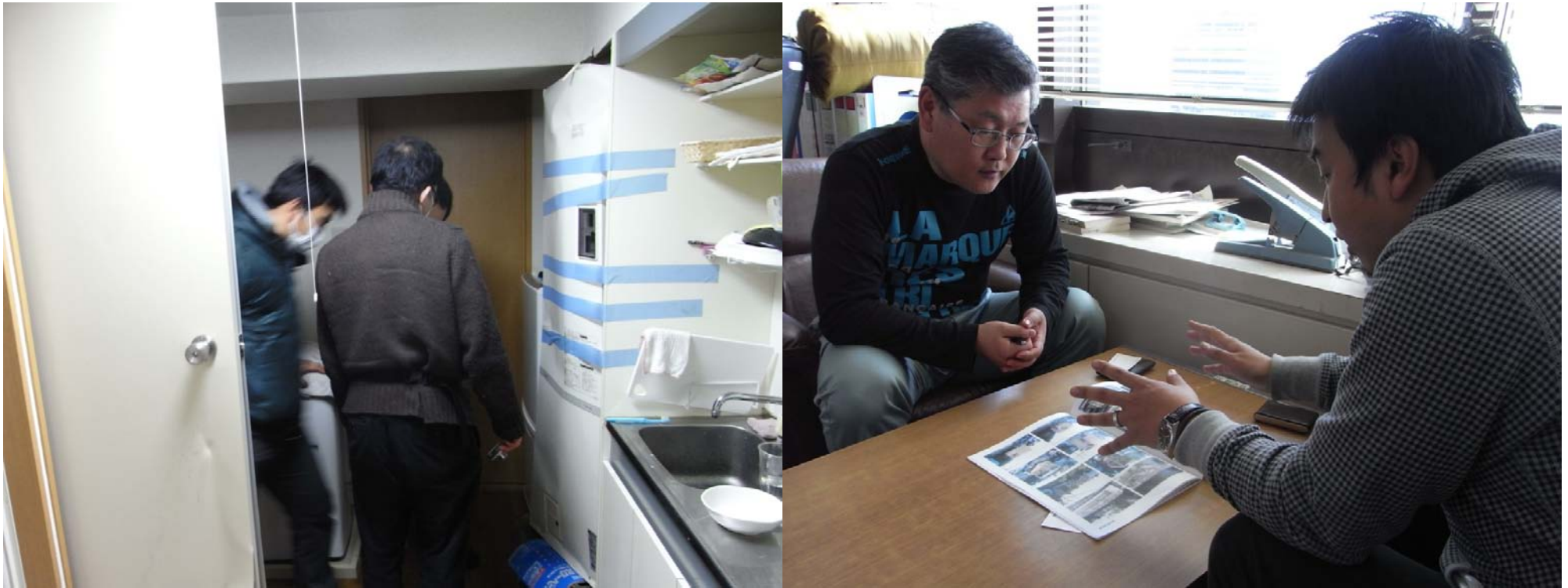
2011.03.28 仙台市 マンションの給湯器が転倒、宮城県庁にてプレゼンテーション